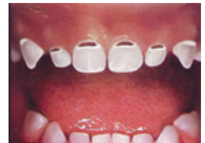
TROISIÈME STADE Des traces brunâtres ou des caries sont visibles à la jonction de la gencive