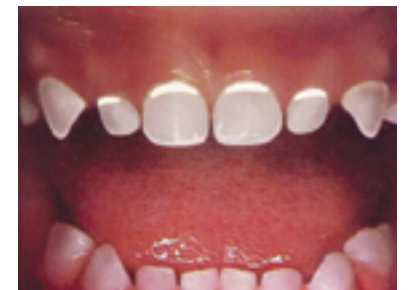
DEUXIÈME STADE Des traces blanchâtres à la jonction de la gencive peuvent indiquer un début de carie.