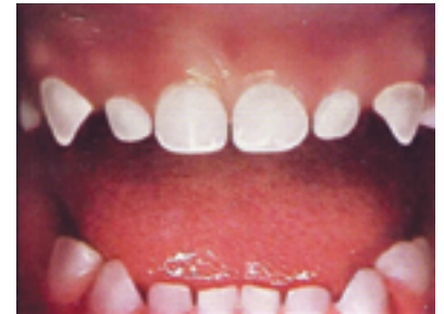
PREMIER STADE Des dents saines